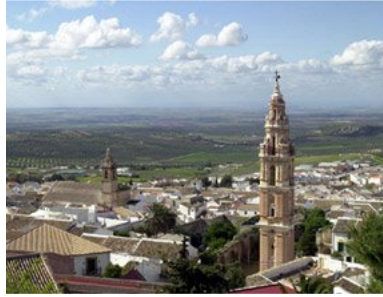
Estepa, au cœur de l'Andalousie.